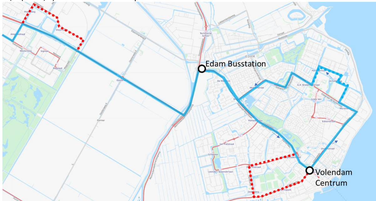
Kaart: route lijn 110 in Edam en Volendam

Lijn 110 zal ook op zondag naar Volendam gaan rijden (nu tot Edam) en we verhogen de frequentie naar 2x/u (nu 1x/u) conform het vervoerplan 2022.