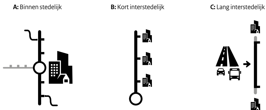
Figuur 2: Ruimtelijke schaalniveaus van BRT

In welke mate deze negen toepassingsgebieden ook daadwerkelijk kansrijk zijn wordt in het vervolg van dit rapport verkend. De kleuren in de matrix geven hiervan al een eerste indicatie. Groen (cellen A-1 t/m B-2) geeft aan dat er een ruim aantal goed gedocumenteerde voorbeelden van deze toepassingsvormen bestaan, waardoor deze toepassingsgebieden in enig detail bestudeerd kunnen worden. Geel (C-1 en C-2) zijn vormen van BRT waar weliswaar praktijkvoorbeelden van bekend zijn, maar onvoldoende in aantal of mate van documentatie om algemene conclusies te kunnen trekken over systeemkenmerken en succesfactoren. Rode cellen (A-3 t/m C-3) zijn BRT-vormen waar nauwelijks praktijkvoorbeelden van te vinden zijn in de literatuur. Dit betekent niet dat deze toepassingsvormen niet kansrijk kunnen zijn, maar voor dit rapport betekent het wel dat ze in minder detail behandeld kunnen worden. De toepassingsgebieden van BRT worden hieronder kort toegelicht. Figuur 2 illustreert de drie ruimtelijke schaalniveaus met een ideaaltypisch voorbeeld.